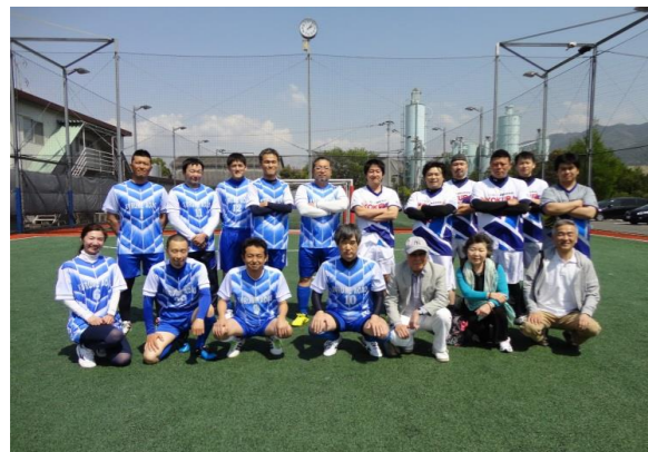
4/22、小倉会青年部と交流試合を行いました

親会事業への協力、部員間の積極的な異業種交流など、今後も元気に活動してまいります！