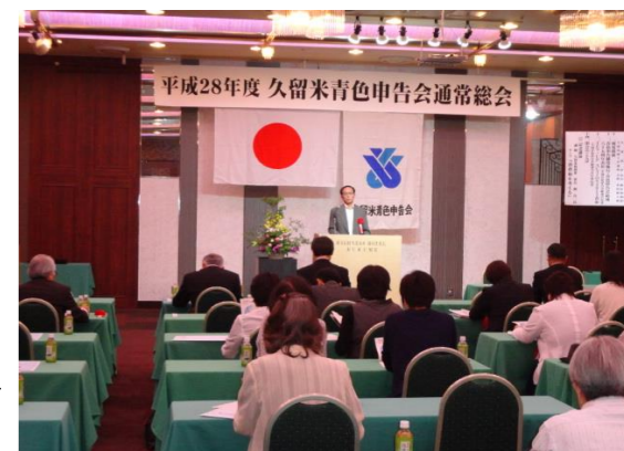
記念講演で講演される久留米税務署 柳署長