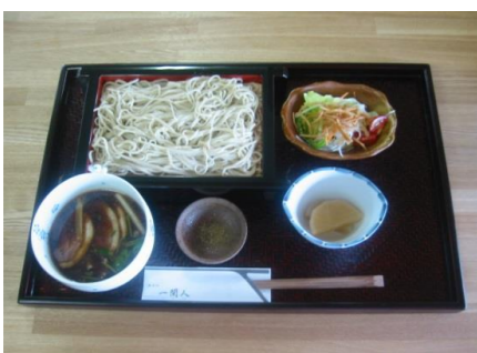
一番人気の「つけ鴨せいろ(1,480円)」